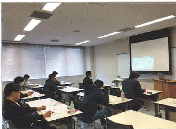
真剣に講義に聞き入っている様子の参加者の皆様

2018年度JSHI公認ホームインスペクター試験を受験される方、受験をお考えの方を対象とし、少人数制の試験対策直線講座を開催しました。受験に申し込みをした方のほか、復習のためにと既に資格を取得した方も参加され、真剣に取り組んでいました。