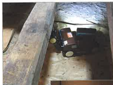
床下では、法人賛助会員である大和ハウス工業様の製品「moogle」が大活躍