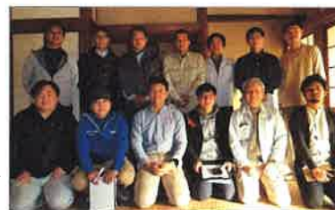
最後は、参加者全 員で記念撮影