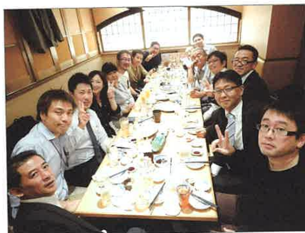
大賑わいの懇親会