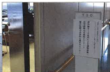
会場の入口の様子