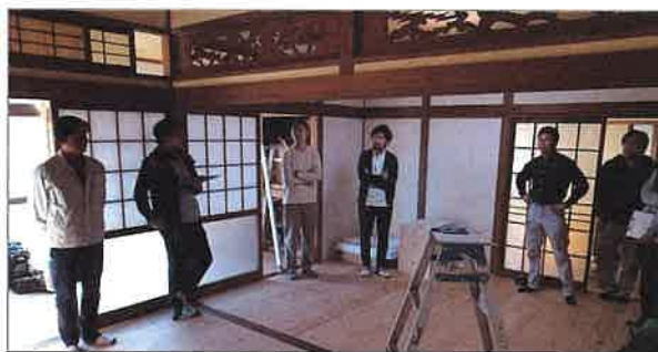
実地研修の物件内部の様子

実際のホームインスペクションに関する知識を学べるというあって、14名の方が参加。3班の少人数のチームに分かれ、ベテランのホームインスペクターが、初参加の方にも分かりやすく知識を伝授していました。