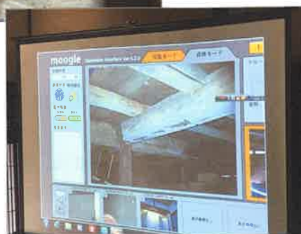
「moogle」が届ける映像。かなりはっきりと床下の状況が確認できました