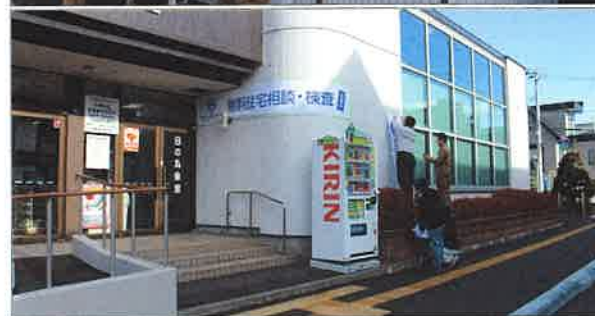
会場設営をする北海道エリア部会スタッフ