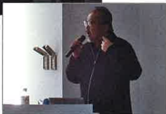
ASHIの報告をする 栃木理事