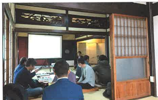
美しい欄間など、魅力たっぷりの古民家が会場

床下点検ロボの実演など、ホームインスペクションのさらなる可能性を発見できる貴重な機会となりました。