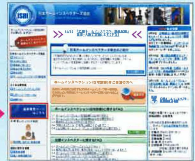
日本ホームインスペクターズ協会ホームページ http://www.jshi.org/