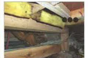
床下の断熱材の落下事象