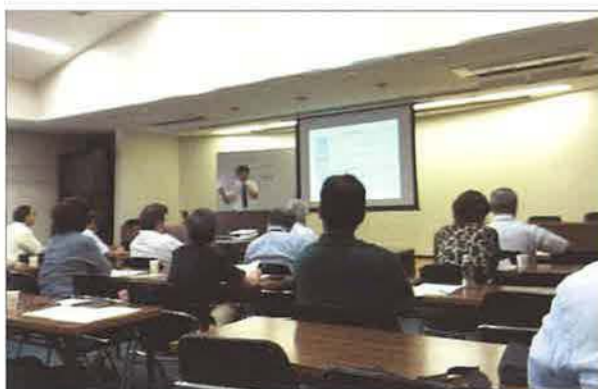
講師自身の不動産コンサル業務体験をまじえながらの解説

NPO法人熊本県不動産コンサルティング協会との共催で、ホームインスペクションセミナーを開催。ホームインスペクションの概要、現在の住宅流通市場におけるインスペクターの立ち位置、宅建業法改正を見据えた今後の展開について講演。JSHIの活動や、11月の認定試験についても言及して告知に努めました。