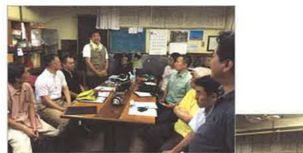
住宅診断終了後のディスカッションの様子

関東エリア部会員が所有する賃貸住宅で実地研修会を行ないました。それぞれの実務に活かせる貴重な意見交換の場となりました。終了後は、互いの情報を共有しながら会員同士の親睦を深め合う懇親会で盛り上がりしました。