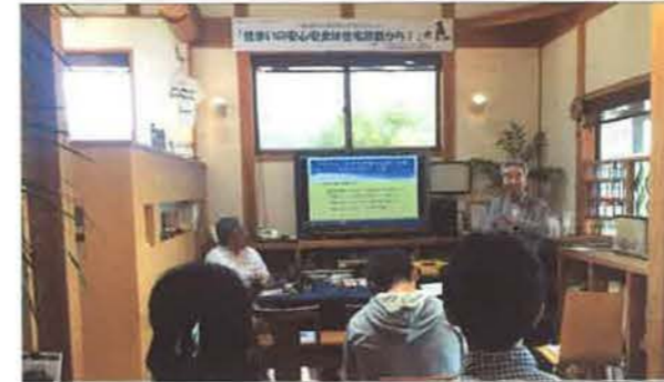
JSHIの活動についても織り交ぜながら、ホームインスペクションの周知に努めました

会員が同業他社と共催で、消費者向けの「住まいるフェア～Summer～」を開催。「家を買うとき・家を売るとき・自宅のチェック 住まいの安心安全は住宅診断から」と題して、午前と午後の計2回、セミナーを開催しました。住宅診断の際に使う道具、ホームインスペクターの仕事と社会的役割について説明しました。