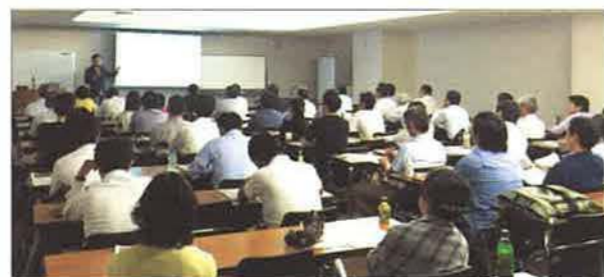
参加者からは、仲介業務に照らし合わせたもの、空家問題に絡めた質問が出ました