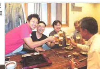
理事長を囲む懇親会には17名が参加