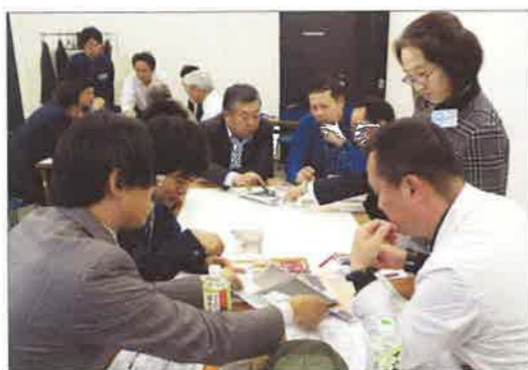
技術系のグループ