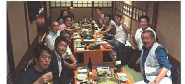
懇親会は会員同士の親睦を深める、貴重な情報交換の場となりました

シアトルで活動中の米国人ホームインスペクターの実例紹介、海外での先行事例をもとに、これからの日本の不動産流通の見通しについて解説しました。講座終了後は懇親会を開催し、会員同士の親睦を深めました。