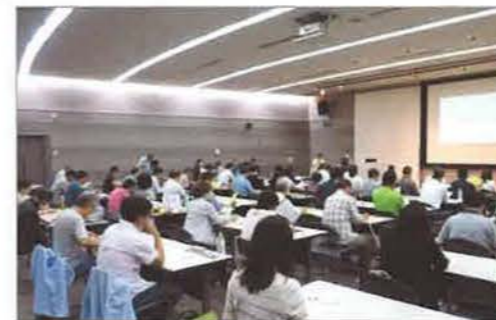
定員100名の会場はほぼ満席。消費者の関心の高さがわかります

6月19日(日) 会場：大阪市立住まい情報センター 広く消費者に向けて、住宅のメンテナンス事例の写真をスクリーンに映しながら、ホームインスペクションについてわかりやすく解説。協会の活動の周知にも努めました。