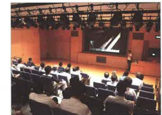
当日は一般来場者を含む34名が聴講