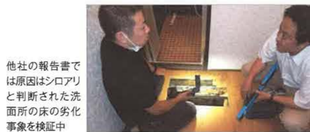
他社の報告書では原因はシロアリと判断された洗面所の床の劣化事象を検証中