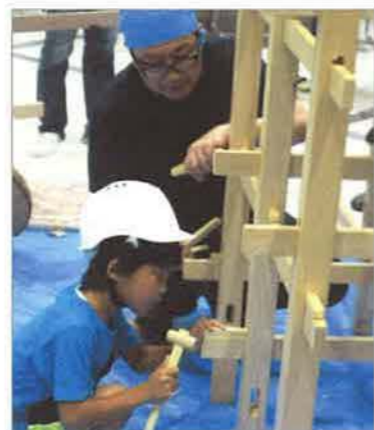
ホゾ穴にくさびを打ちこんで構造体(ジャングルジム)を固定