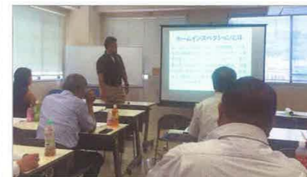
参加者からは「とても勉強になった」「もっと詳しく聴きたい」との感想をいただきました

鹿児島市内の不動産業者19社で組織する任意団体(木曜会)でセミナーを行ないました。ホームインスペクションの概要、そのほかの住宅瑕疵保険検査や耐震診断との違い、宅建業法改正後の展望について、約2時間にわたって解説。インスペクション中に撮影した瑕疵部分の写真を事例に、どのような対応が望ましいのかなどを考えてもらい、ホームインスペクションの重要性について理解を深めることに注力しました。