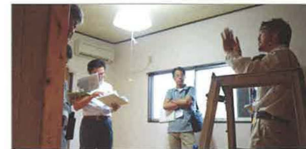
その場で疑問点が解消できるのも実地研修の利点のひとつ