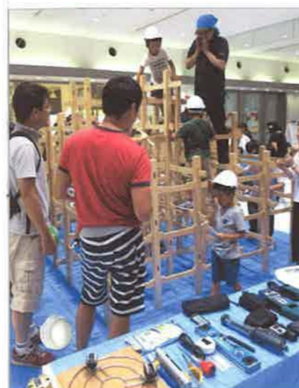
会場の一角にはインスペクションで使う道具類も展示