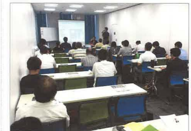
理事長セミナーは名古屋会場でも4都市め