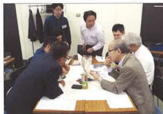
設計系のグループ