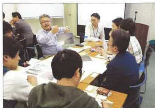
不動産系のグループ