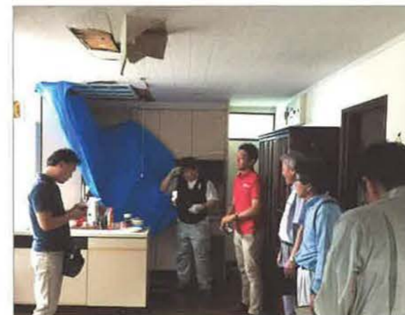
物件の劣化事象について参加者同士で意見交換