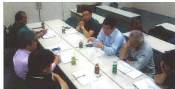
会議中の九州エリア部会有志役員

熊本地震で被災した会員の状況、JSHI理事会や近畿エリア部会からの義援金受領に関する報告など、有志役員で情報を共有しました。