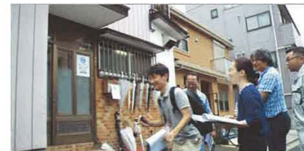
築38年の木造住宅を使った実地研修

築38年の賃貸住宅を使って、座学セミナーではなかなかわからない劣化の事象を、実際にじっくりと「見て」「触って」「理解する」ことを目的に開催。参加者を3つのチームにわけ、チームリーダー指導のもと、一日も早く現場デビューができるように、劣化状況の診断、検証、報告の仕方について、その都度、経験豊富な先輩会員のアドバイスを受けながら、現場の流れを体感してもらいました。最後には、依頼者から出そうな質問で「抜き打ちテスト」をしたり、内容の濃い研修となりました。