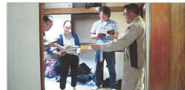
女性の会員も積極的に参加しています