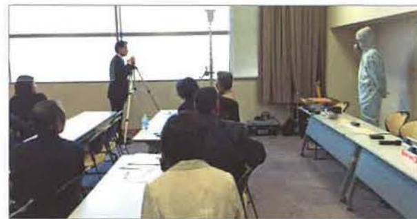
室内の床・壁レベル調査と、床下調査について、機材と床下検査の際に着る防護服を示しながら実演

不動産業者向けに不動産鑑定士が定期的に行なっているセミナーにおいて、今後の宅建業改正を見据えて、ホームインスペクションに関する講演依頼があり、3月に引き続いてセミナー講師を担当しました。前回までが全体的な説明だったので、今回は実務に寄せた内容に。住宅診断の場で使う道具類も説明しました。