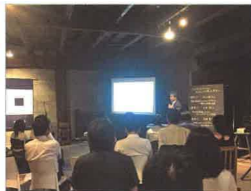
会場は、マーケットや芝居小屋などに使われる、明治期の木造倉庫をリノベーションした施設

リノベーション住宅推進協議会熊本支部主催イベントに参加し、「不動産流通におけるホームインスペクションの役割」と題して講演しました。宅建業改正の内容や、JSHIが考えるホームインスペクションと瑕疵保険申請時の検査との違いについて、聞き手の異業種従事者が正しく理解することによって、彼らの先に存在する一般消費者の啓発となればと考えています。参加者からは、熊本地震発生を受けて、耐震診断とホームインスペクションの違いを確認する質問を受けました。