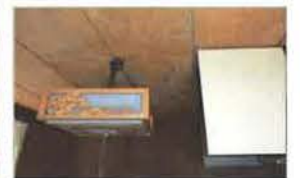
地震で瓦が落ち、2階の雨漏りが1階天井まで浸透