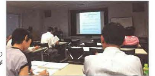
近畿エリアの会員35名が参加

6月24日(金) 会場：大阪産業創造館 研修室 新しく入会した会員を迎えて、必要な情報を交換しながらホームインスペクションに関する知識の向上を図り、交流を深めました。