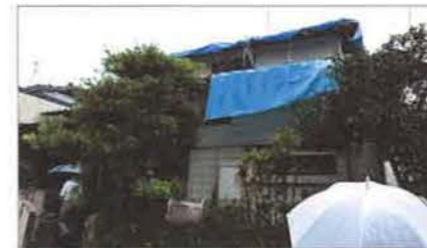
築36年、旧耐震前の木造住宅が会場

熊本地震で被災し、解体が決定している中古戸建住宅を借りての実地研修。地震による家屋の傾き→屋根瓦のずれ→雨漏り→腐れ・カビが発生するという、被災住宅で一般的にみられる状況が目に見えてわかる、今後の診断に役立つ研修となりました。講師が通常に行なっている診断手順に沿って進行し、参加者が質問したりその場で意見交換を行ないました。終了後は懇親会も開催しました。