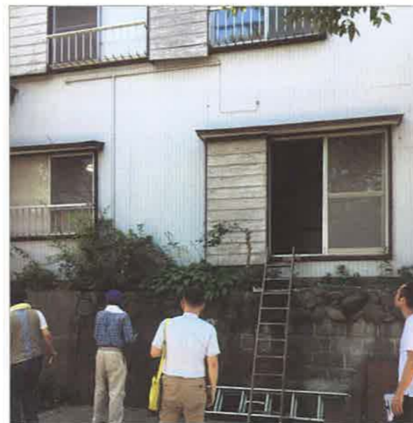
築約40年の木造賃貸住宅を使つての実地研修会

関東エリア部会員が所有する賃貸住宅で実地研修会を行ないました。それぞれの実務に活かせる貴重な意見交換の場となりました。終了後は、互いの情報を共有しながら会員同士の親睦を深め合う懇親会で盛り上がりしました。