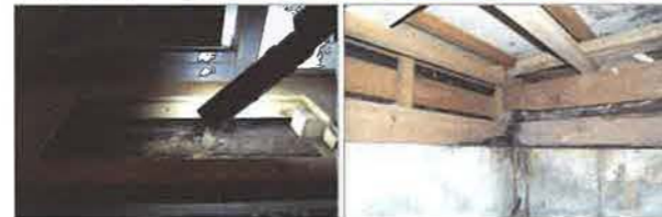
左：洗面所の床板を切り欠いて見えた部分。劣化原因は蟻害? 腐食? この判断が実は難しい 右：浴室側面の床下部分。土台が腐り、基礎の水染み跡を蟻道と見間違えやすい診断箇所