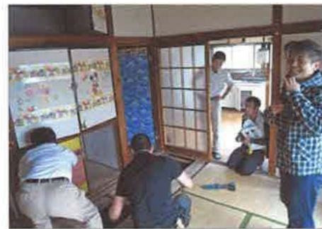
和室の畳と下地板を外し、他社報告でシロアリ被害判断とあった箇所の技術検証にトライした