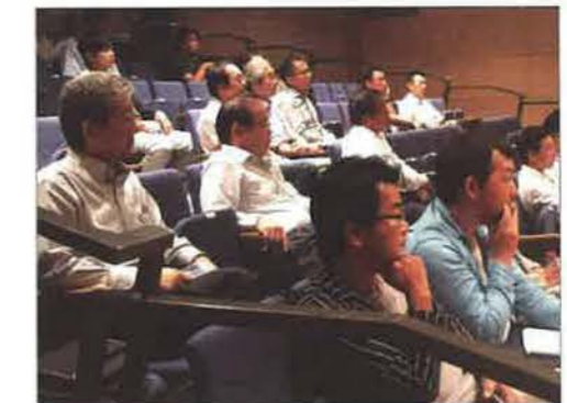
熱心に聴き入る参加者