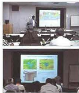
部屋の隅を赤外線サーモカメラで撮影した場合の事例解説

赤外線サーモグラフィの正しい使い方、カメラが捉えた赤外線放射エネルギーの数値をどのように分析し、住宅診断に活かしているのかなど、実践的なセミナーとなりました。