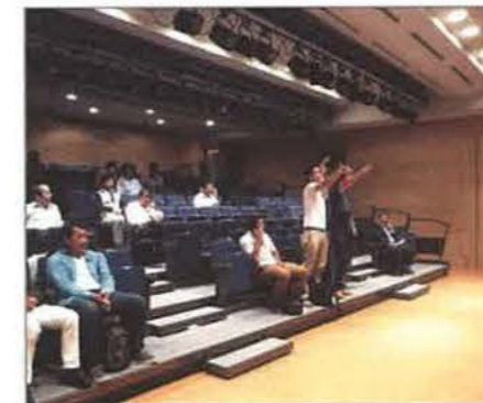
終了後はじゃんけん大会を開催、勝利した3名に「過去問題集」をプレゼント