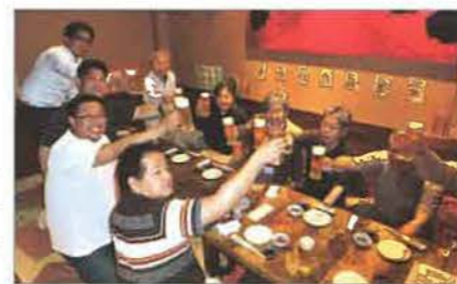
日頃の活動やホームインスペクションの未来を語りあつた懇親会