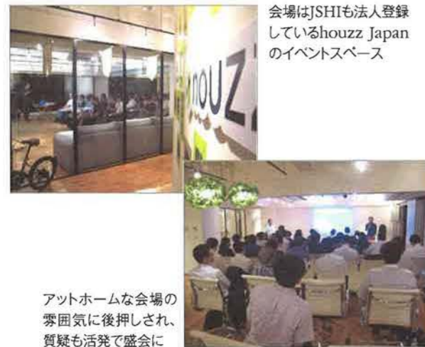
会場はJSHIも法人登録しているhouzz Japanのイベントスペース

追加講演 9月26日(月) 会場：都内 houzz Japan 東京・八重洲会場が早々に定員に達したため、急ぎよ追加講演を組みました。