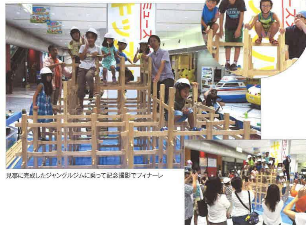
見事に完成したジャングルジムに乗って記念撮影でフィナーレ