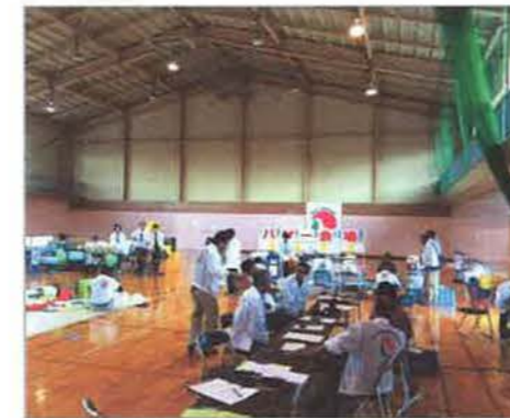
「第33回不動産フェア」会場の様子