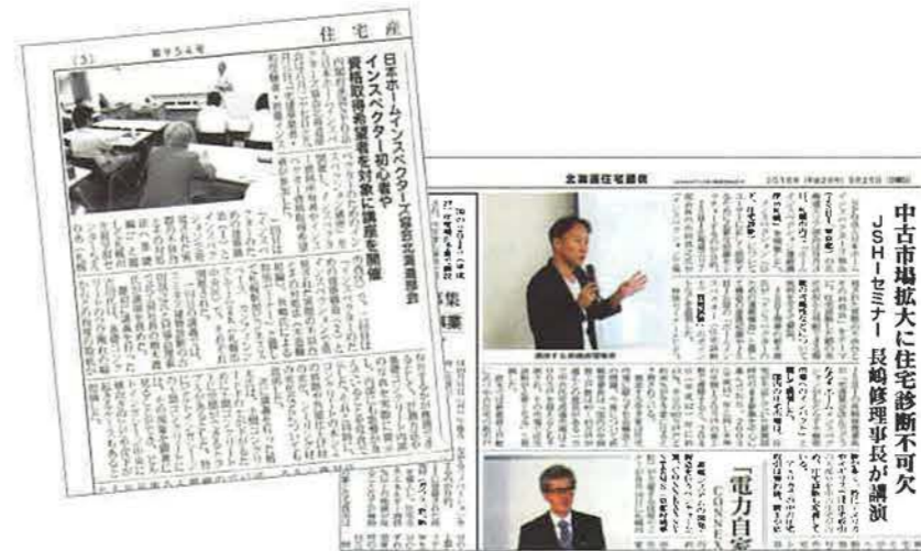
北海道エリア部会主催のセミナーについて地元紙の取材を受け、業界動向欄に記事が掲載されました(9月16日「住宅産業新聞」、9月25日「北海道住宅通信」)