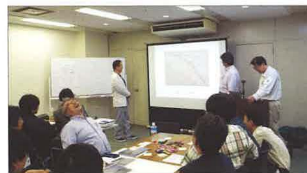
関東エリア部会では恒例のシミュレーション型ワークショップ

技術、不動産、設計など、参加者の属性ごとのグループにわかれ、インスペクション事例ごとにシミュレーションとディスカッションを行ないました。ワークショップ終了後は懇親会を開催し、会員同士の親睦を深めました。