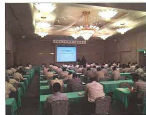
宅建業従事者でほぼ満席となった会場

8月10日(水) 会場：仙台市 一級建築士事務所 Wa-arch (※東北エリア部会長の事務所) 有志役員による会合。本年度の活動計画について打ち合わせました。