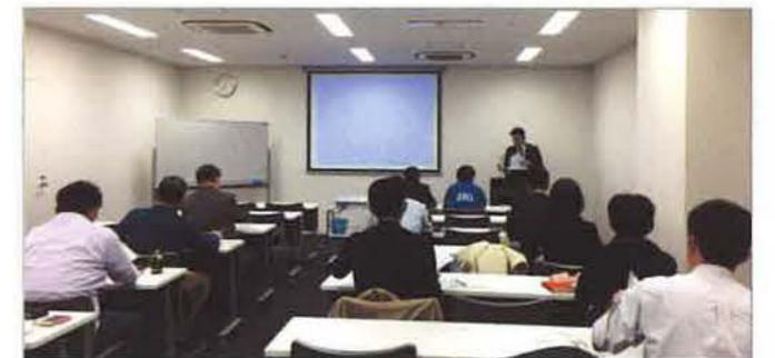
第1部の講師は外部団体より招へいしました