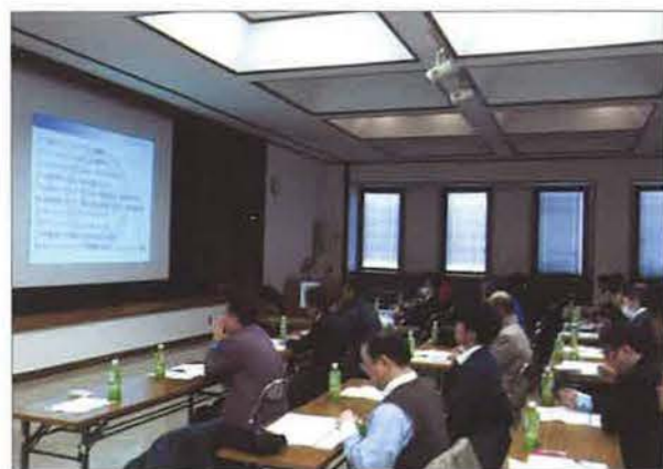
1部と2部をあわせて31社39名が参加。当日の様子は同協会会報誌「おかもやま宅建」でも紹介されました

岡山県宅地建物取引業協会津山支部が、所属会員へ向け実施した研修会の第1部に、エリア部会長が講師として登壇、「ホームインスペクションについて」と題して講演しました。宅建業法改正を前に、宅建業者もインスペクションについて理解しておくべきという、意識の高さを感じました。