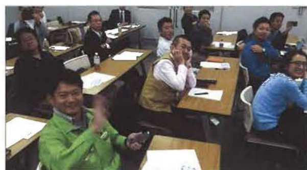
当日は35名が参加(講師が持参して試験飛行させたドローンから撮影)