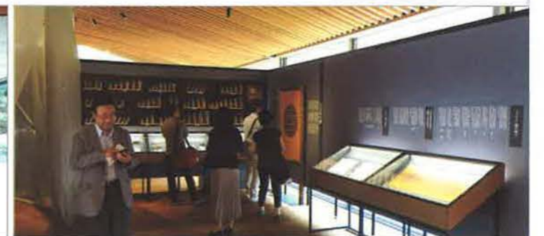
見学時は企画展「土のしらべー和の伝統を再構築する左官の技」を開催中