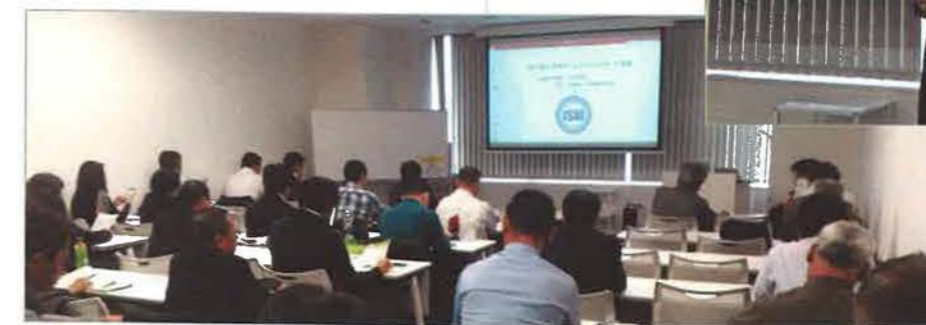
新たに入会した会員を中心に33名が参加しました