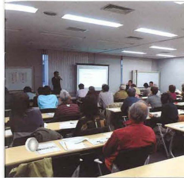
定員50名のところ60名の応募がありました