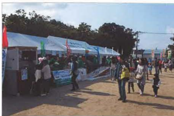
当日は好天にも恵まれ、地元の来場者で賑わいました