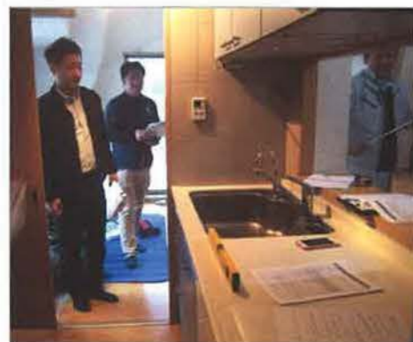
水平器でキッチンカウンターに傾きがあるかを測定中

築約15年の集合住宅の一室を会場に、約3時間にわたって実地研修を行いました。会員10名が参加しました。