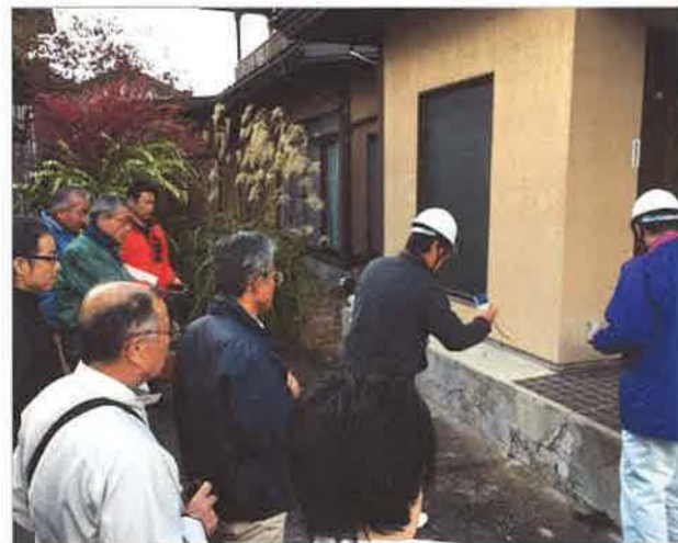
玄関付近のクラック、コンクリートの表面が剥離した状態をJSHI会員が診断中