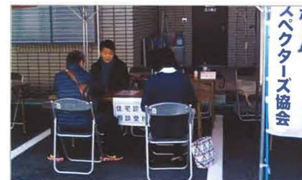
住宅診断相談コーナーには3組が来場しました