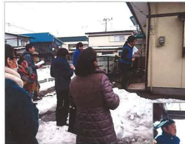
この日の盛岡市は日中の気温が5~6℃という寒さのなかでの開催

中古住宅で先に実地研修を行い、使う道具や診断のポイントを具体的に説明。続く座学でおさらいをして理解を深めました。実地研修には非会員の6名を含めて16名が参加、広域である東北では初となる岩手県内での研修会開催ながら、ホームインスペクションへの関心の高さがうかがえました。