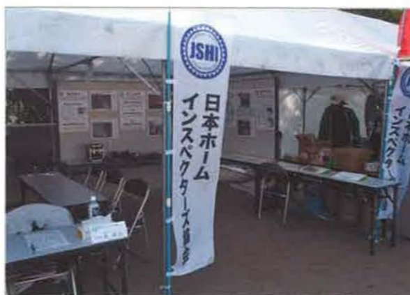
特製の「のぼり」をたてて集客を狙う

ホームインスペクション普及を狙い、地域密着型イベントに出展しました。テントを張った専用ブース内に、瑕疵事象などの事例写真をパネル展示し、常駐した会員による住宅診断相談コーナーも設けました。