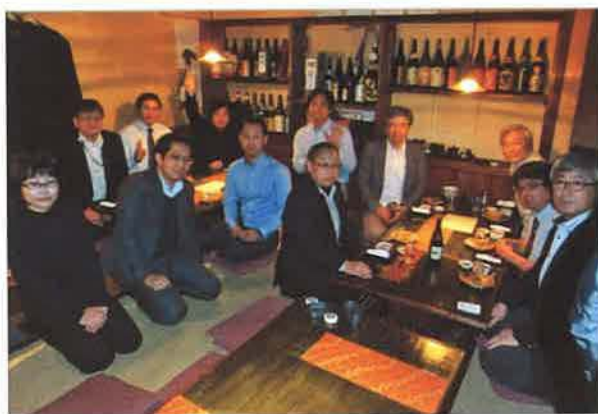
14名が参加した懇親会では、互いに熱い想いをぶつけあいました