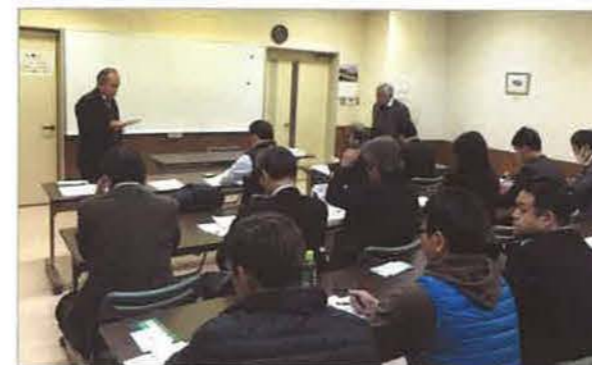
小さな支部にあつて、20名の参加者はインスペクションへの関心の高さの表われ