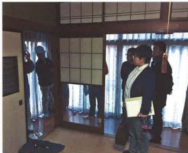
インスペクションの様子を模擬体験することで、宅建業者の住宅診断への理解を深めることができました