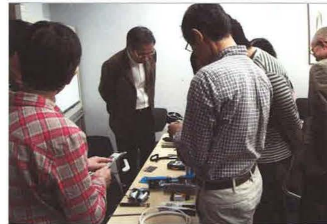
初めて目にする道具類に興味津々の参加者たち