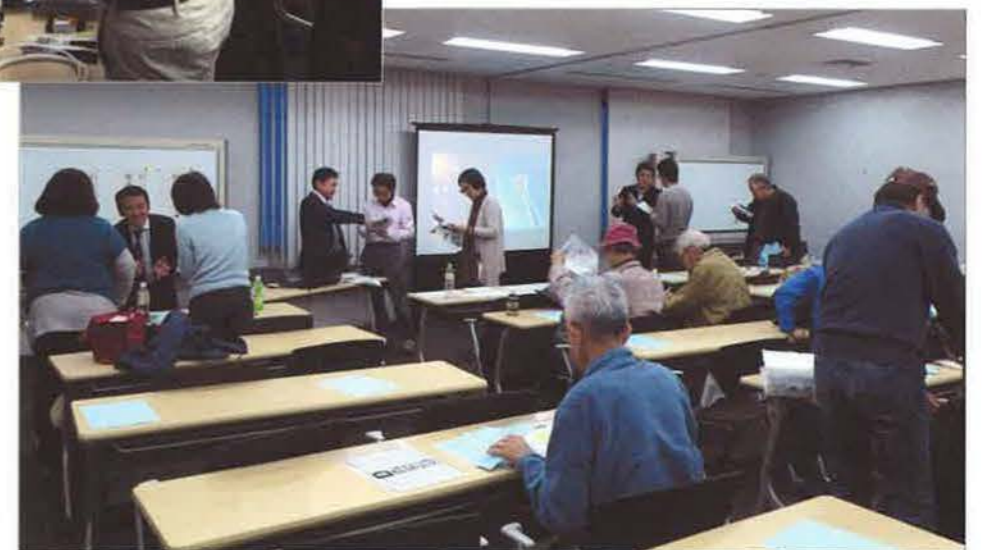
質疑応答終了後も参加者からの相談は続き、運営した近畿エリア部会の会員が丁寧に対応しました