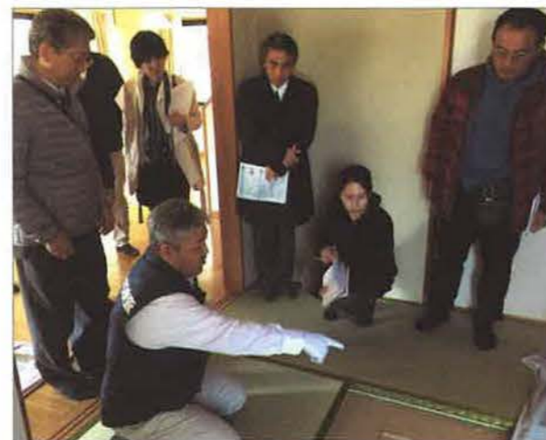
当日の様子は3月15日発行の『中国新聞』朝刊と、3月28日発行の旬刊『山口経済レポート』でも紹介されました