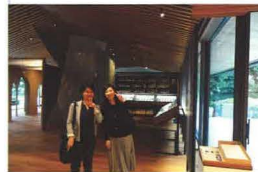
木の香りに包まれた館内。道具に触れたり、カンナくずの香りを嗅いだりできる体験型展示も

次にご紹介する近畿エリア部会では、定例会に先立ち、日本で唯一の大工道具のコレクションを有する竹中大工道具館の見学ツアーを企画するなど、7エリアのなかでも特に活動が盛んです。