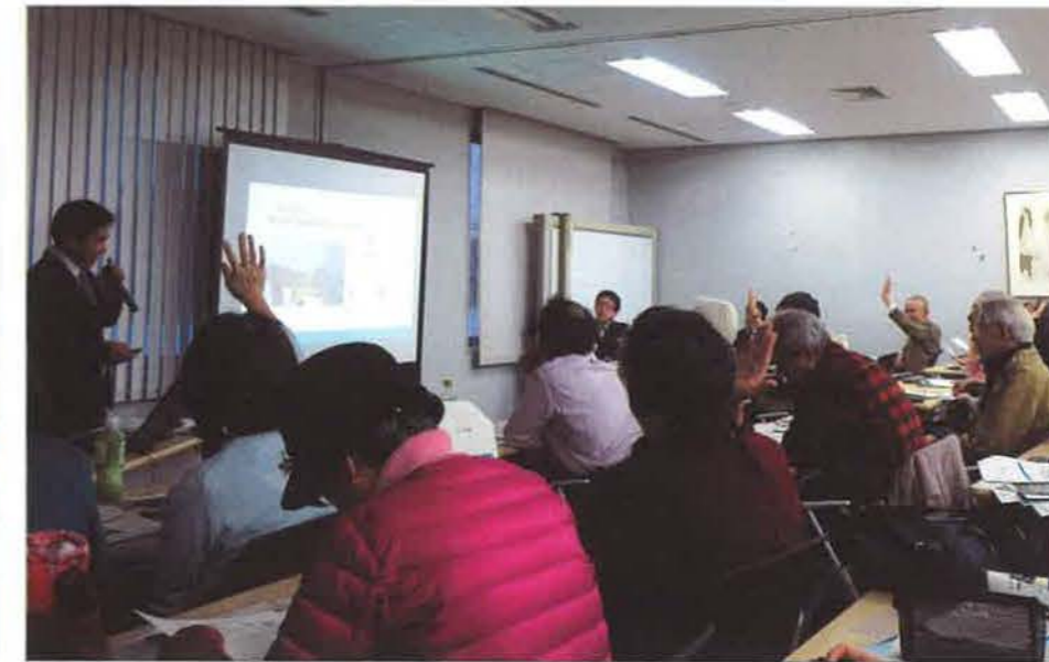
クイズ形式で、楽しみながらホームインスペクションへの理解を深めてもらいました