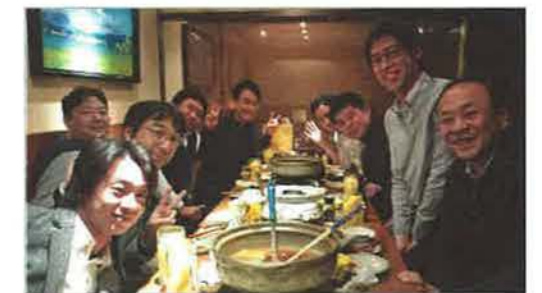
地域を超えた意見交換も活発で、おいに盛り上がりました