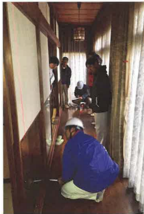
レーザーを使って床の傾斜を測定中

通常の業務ではホームインスペクション(住宅診断)に接することのない不動産関係者、主に宅建士を対象に、中古物件で実際にホームインスペクションを行いながら解説する実務的な見学会を実施しました。午前と午後に分けて県内2か所で同日開催し、合わせて23社が参加。講師は東北エリア部会の会員3名が務め、うち1名は場面ごとの道具の使い方を説明、ほかの2名はインスペクションを行いながら劣化状況の解説を加えました。見学会終了後、講師がまとめた診断報告書の簡易版を参加者に配布することで、現場で見聞きしたことがどのようにまとめられるのかを理解してもらうことができました。