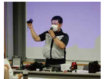
▲調査用道具は実物を用いて使用方法を学習。