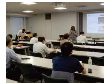
▲19名の参加者が熱心に講義に参加しました。