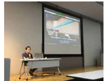
▲実地研修の代わりに動画や調査写真を交えながら解説。