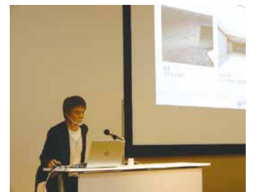
▲具体的な場所別のメンテナンス方法を事例写真を交えて解説。