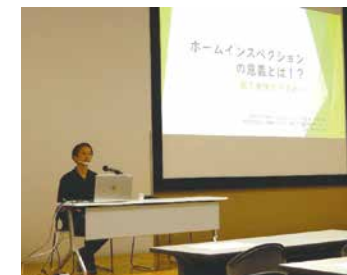
▲インスペクションの第三者性の重要性を改めて確認。