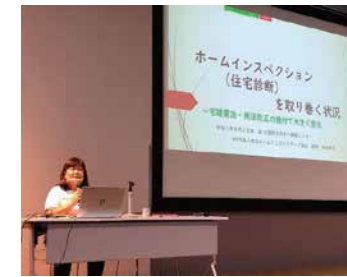
▲売主リスクヘッジの観点と売買双方の注意点を解説。